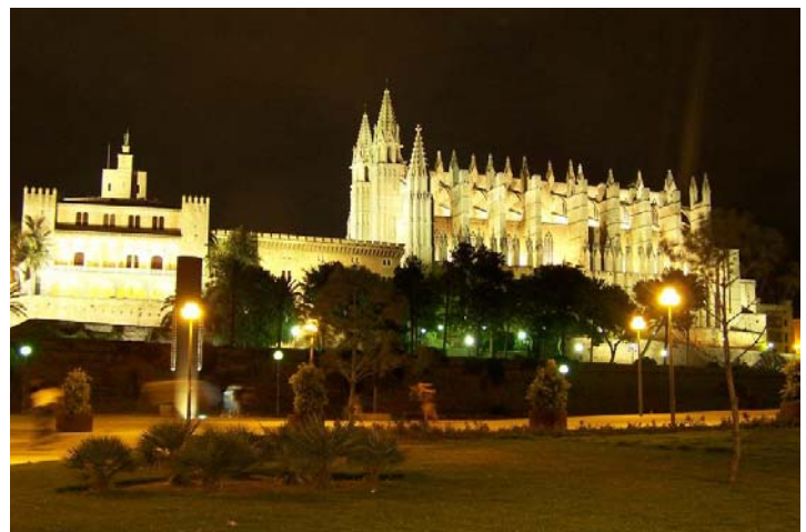
Catedral y Palacio de la Almudaina.