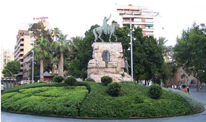
Centro de Palma.