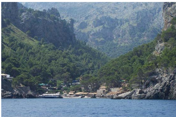
Puerto de Sa Calobra