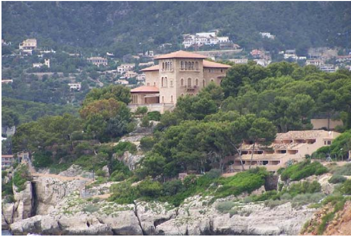
Palacio de Marivent.

Este día lo dedicamos a conocer un poco mas a fondo la ciudad de Palma, que es bastante grande y cosmopolita, estacionamos en el mismo sitio que cuando llegamos ya que a la mañana siguiente zarpaba nuestro buque a las 12.00 horas, con destino a Valencia y el puerto deportivo de la zona de embarque esta a tan solo unos minutos.