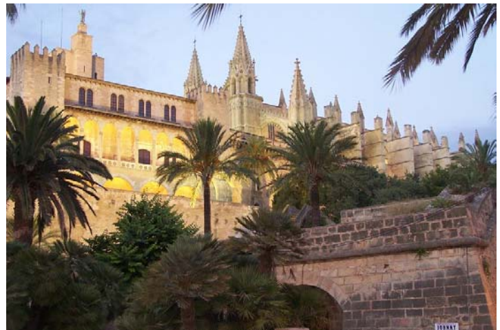
Catedral de Palma.