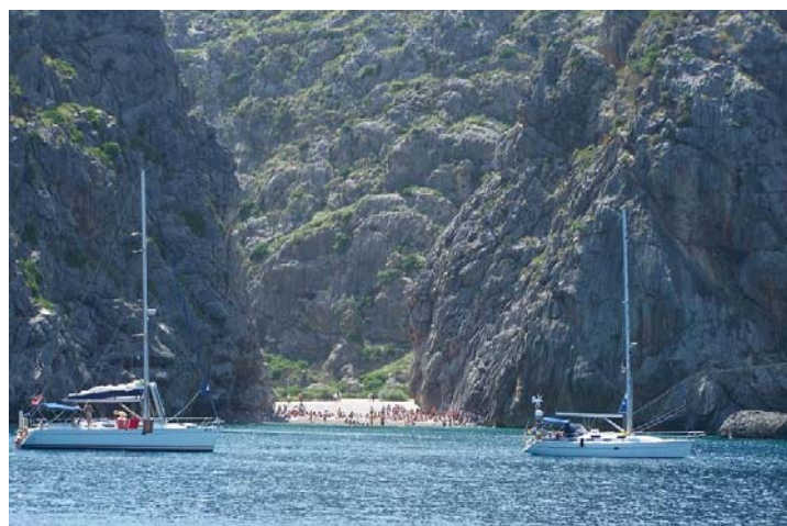
Torrent de Pareis desde el mar