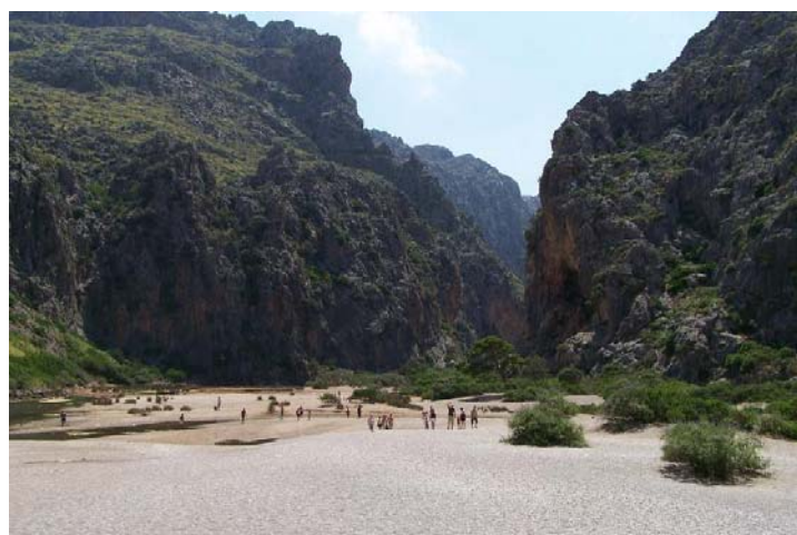
Torrent de Pareis desde Tierra

Llegamos de la excursión sobre las 18.00 horas con tiempo todavía para un último baño en las playas del puerto de Sóller, duchita y para Sóller, un pueblito con un encanto especial y abrigado por la sierra de tramontana, con infinidad de fuentes de agua potable por sus calles, con lo que no nos fue difícil repostar agua, que por cierto, no nos ha sido difícil en prácticamente ningún sitio de la isla.