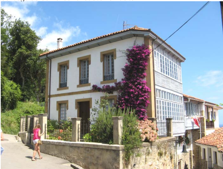
La famosa casa de Llastres

Visto lo visto, nos vamos a la playa de la griega, en la población de Colunga, para darnos un bañito, ya que a las dos de la tarde, el sol empieza a picar con fuerza. En esta playa, hay un camino que nos lleva hasta una zona donde existen huellas de dinosaurios solidificadas de la época jurásica, en las rocas de la costa. Después del bañito y de la visita a las huellas, vuelta otra vez al camping, esta vez sobre las 6 de la tarde. Habíamos conseguido con el baño retrasar la vuelta.