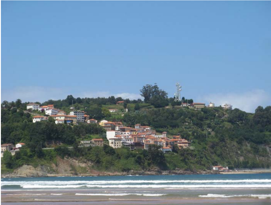
Playa de la Griega. Colunga