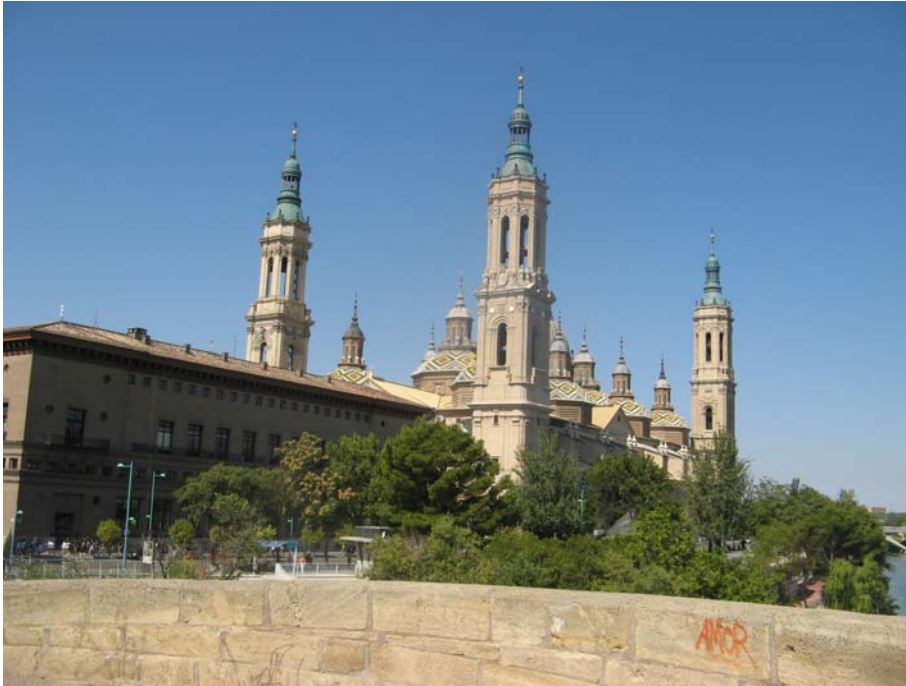
Basilica del Pilar de Zaragoza