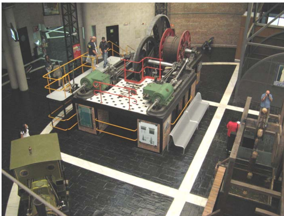
Museo de la minería

Llegamos al museo a las 10 de la mañana y tras pasar por caja y desembolsar los correspondientes 15 euros, nos dejan pasear por su interior, hasta la hora prevista donde nos descienden a la mina para poder observar como trabajaban y en que condiciones lo hacían. Al final del recorrido, te das cuenta de lo peligrosos e insalubres que son algunos trabajos y nosotros quejándonos de los nuestros. Los niños salieron encantados de la visita por la mina y el poder bajar a tantos metros de profundidad bajo tierra. Tras la visita aprovechamos ahora si para poder ver tranquilamente el museo, donde te explican los utensilios de trabajo que usaban, las técnicas, la vida de los trabajadores, sus enfermedades, etc, e incluso los niños pudieron divertirse dando vueltas a una rueda enorme. Es un museo que merecería el título de imprescindible y que te da una idea de este oficio y los peligros que entrañaba.