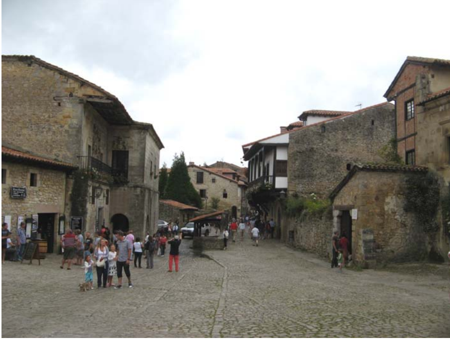
Santillana del mar

Quiero reseñar que en esta relato, no encontrareis ninguna explicación referente a los picos de Europa, y es porque en el anterior viaje que fuimos, si lo visitamos y tuvimos que soportar una larga espera para coger el funicular que te subía a la base de los picos o bien una caminata bastante larga para niños. Viendo lo que se avecinaba, si íbamos con niños, y dado que a ellos no les entusiasmaba demasiado la idea, decidimos suspender esta visita. Aunque recomiendo que la haga todo aquel que visite por primera vez Cantabria.