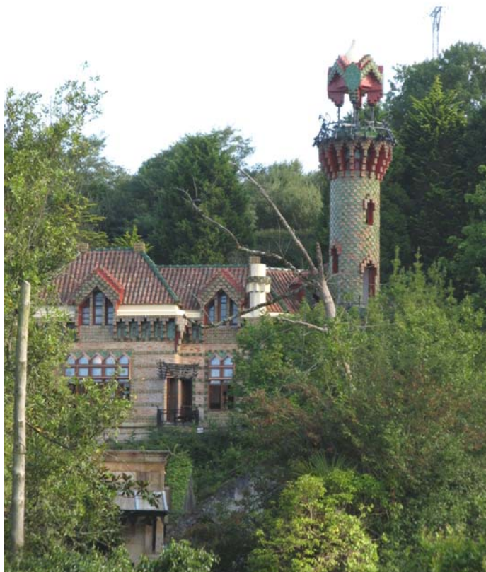
El capricho de Gaudi (Comillas)

jardines y el palacete de verano con su torre "El capricho" del arquitecto Antoni Gaudi, donde previo pago de la entrada se puede visitar solo o en grupos.