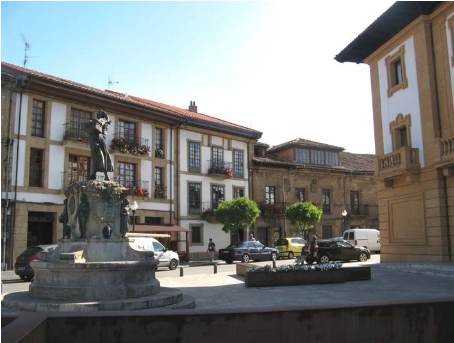
Plaza Obdulio Fernández. Villaviciosa

Cogemos el coche y siguiendo el curso de la Ría, nos desplazamos hasta la población de Tazones. Una población que animo a la gente que vea, ya que todavía conserva el encanto de los pueblos de antes (dentro de lo que cabe). El paseo por sus calles empinadas es toda una delicia, a la par que la visita del puerto, y una casa toda revestida de conchas, donde los turistas se fotografiaban.