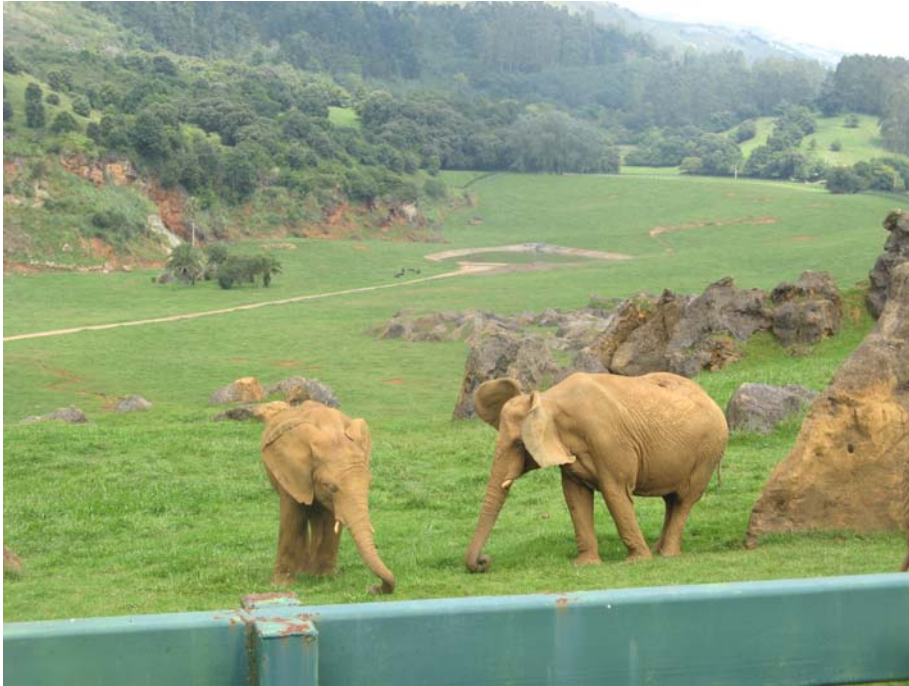
Parque de la naturaleza de Cabárceno

Al salir nos dirigimos a visitar la población de Liérganes. Este pueblo es una verdadera sorpresa, ya que tiene un conjunto monumental que nos encanta. Este conjunto es dominado por dos grandes montes, uno de ellos el Cotillamon, se le conoce como "las tetas", por su forma. Todo el conjunto es monumento histórico-artístico con una arquitectura de los siglos XVII y XVIII. No hay que perderse la casa de los cañones y el puente sobre el río Miera, como principales, aunque hay bastantes más. Como ya eran cerca de las 8 de la noche, nos retiramos al camping dando la jornada por concluida.