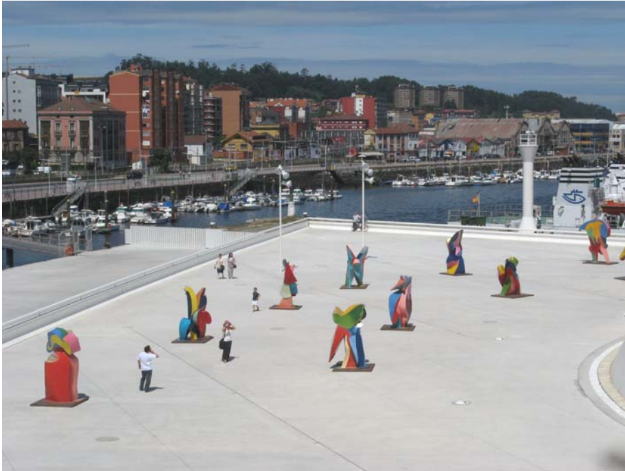
Centro Niemeyer. Avilés

Dado que es la hora de comer, vamos a uno de los establecimientos que se habían apuntado en uno de los hilos de webcampista sobre comer bien y barato, sidrería la cantina, pero al llegar ya no existía, con lo cual acabamos recabando en otra, de la que no salimos contentos, ya que otra vez los niños acaban pidiendo patatas bravas, y nos las traen solo con tomate frito y la sidra parecía que hubieran vuelto a llenar la botella con sobras, vaya para no volver. Desgraciadamente no conservo este ticket, con lo cual no puedo decir el nombre de la tasca. Por la tarde, hacemos la visita del Cabo de Peñas, este sí mas turístico que el anterior y totalmente acondicionado. A la entrada, existe un punto de información, con una estatua de un calamar gigante atrapando, a lo que parece ser una ballena, a la vez que todos los caminos tienen barandillas. La vista es fantástica.