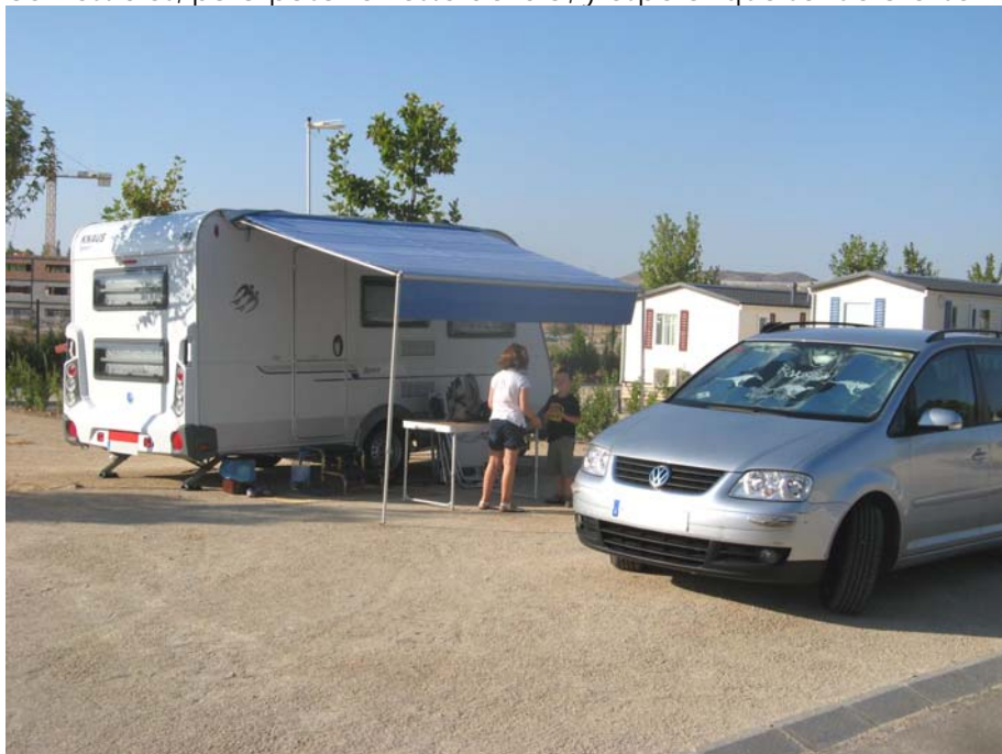
Camping Ciudad de Zaragoza

Poco después llegamos al camping ciudad de Zaragoza, donde no hacía falta reserva, tal como comprobamos, ya que la dificultad estriba en encontrar una sombra. Nos decidimos a estacionarnos cerca de la zona donde estaban los servicios y la piscina. Craso error, con el calor el aire que nos llegaba era bastante insoportable. Dejamos la caravana y el coche a pleno sol y decidimos irnos a comer debajo de un conjunto de árboles que se encontraban cerca de la piscina. Eso sí, antes y después de la comida, estuvimos todo el rato que pudimos en la piscina o en el bar que estaba refrigerado. Por la tarde, nos acercamos hasta la primera tienda que encontramos a comprar comestibles, para pasar el resto del día, y esperar que se fuera el sol.