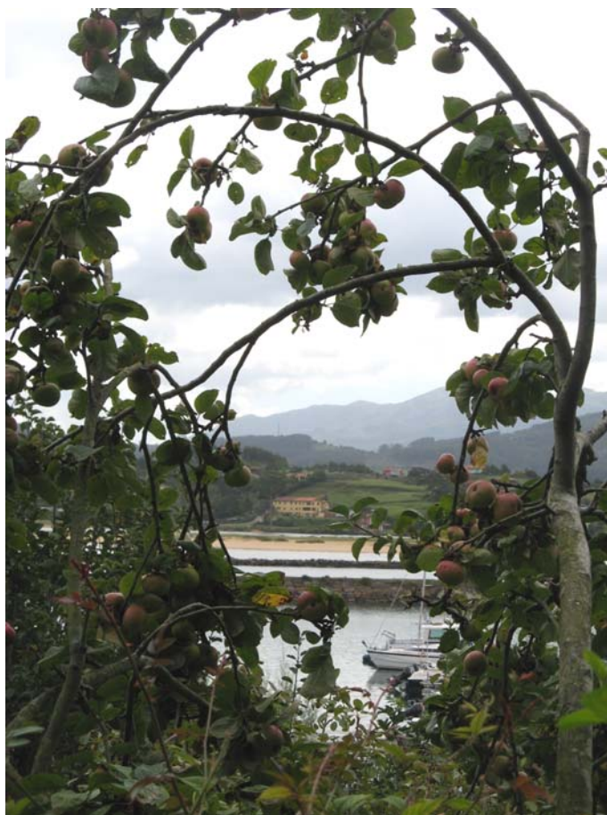
Las manzanas de Asturias con la ria de Villaviciosa

En la visita a Cantabria, teníamos pensado ir a visitar los bufones, pero para ello es necesario que la mar este en malas condiciones, y durante el tiempo que estuvimos allí no fue la más idónea. Por esto he puesto al principio que no descartamos en un futuro volver a estas preciosas tierras para acabar el recorrido que no pudimos hacer.