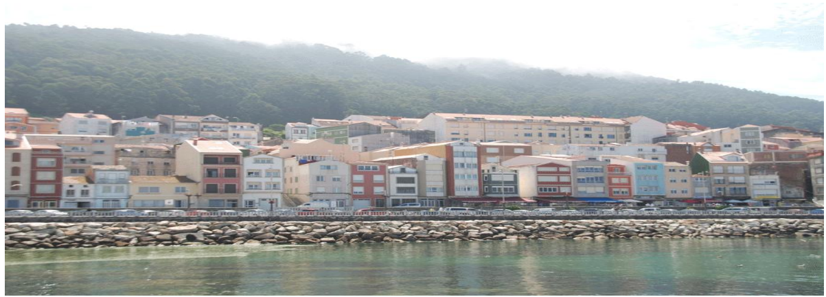
A Guarda desde el paseo marítimo