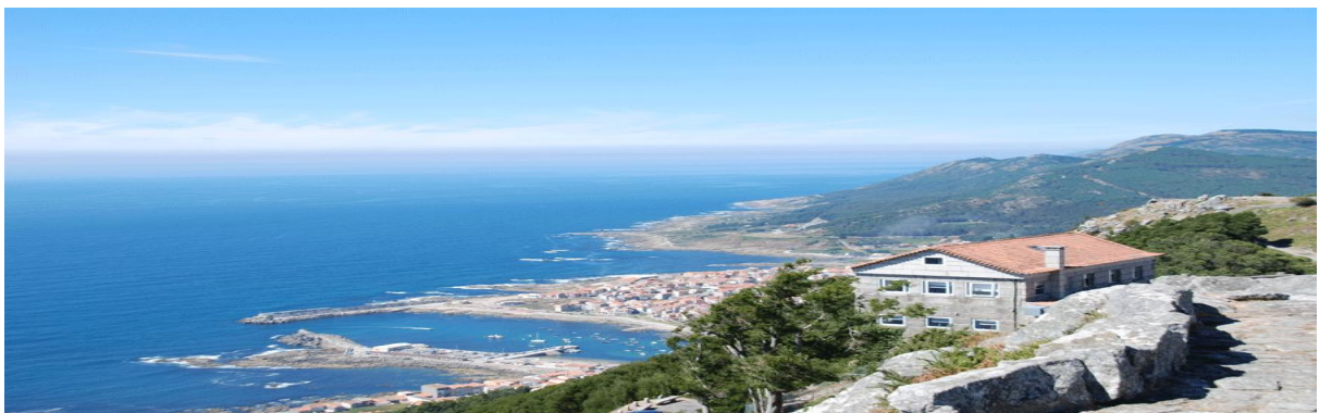
Desembocadura del Miño desde el monte Tecla