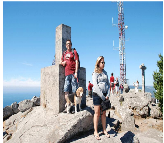
monte Tecla