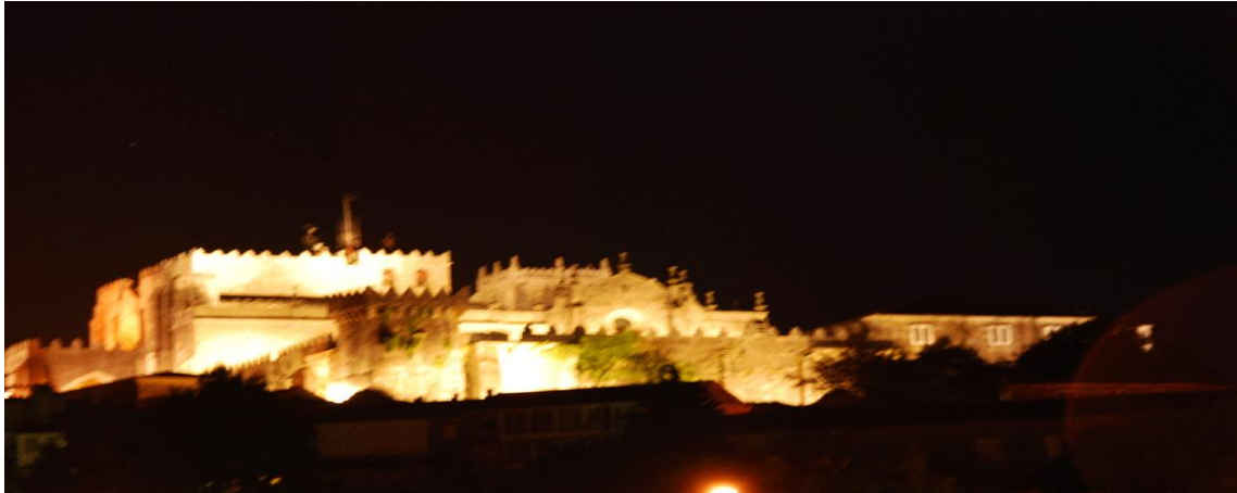
Tui desde el área de autocaravanas