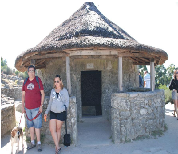
castro en el monte Tecla