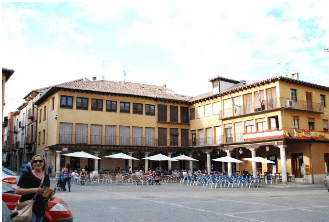
Tordesillas Plaza Mayor

Tordesillas es una ciudad cargada de Historia, la vista desde la margen izquierda del río Duero antes de cruzar el puente es soberbia, justo enfrente de este están las Casas del Tratado junto a la Iglesia. La visita al casco antiguo agradable y tomarse un refrigerio en la plaza un verdadero placer.