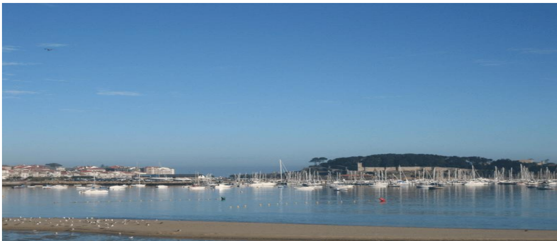
Baiona, puerto deportivo y al fondo Parador de Turismo

Ya abajo decidí darme un chapuzón en la playa antes de marchar, j...der que fría está el agua por estas tierras, vale que yo no soy de caldos pero esto supera mis expectativas de lo que para mí es el agua "fresquita".