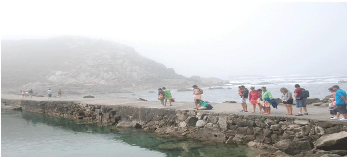
Islas Cíes