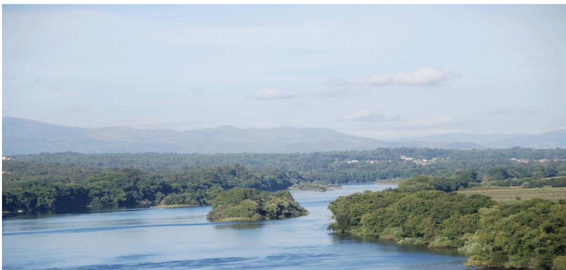
El Miño desde los jardines de la Catedral de Tui

En la época castreña (s. VIII-VII a. C. a I d. C.) aparece la construcción de poblados estables y fortificados en las cimas de los montes y oteros, los llamados "castros". En la cima del monte Aloia hay unos cinco castros simétricamente dispuestos alrededor de la cima de dicho monte, sólo uno de los cuales está acondicionado para las visitas. En lo alto de la cima está la construcción más enigmática de Tuy, casi 3 km de murallas semienterradas que nadie ha podido datar con precisión.