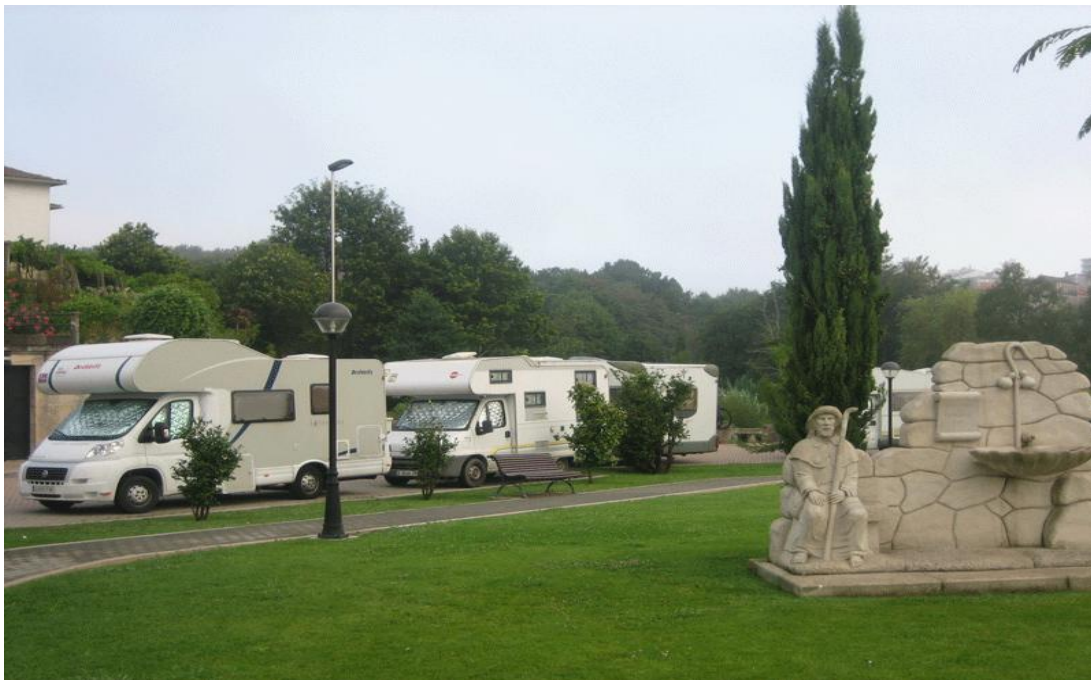
Área de autocaravanas en Tui