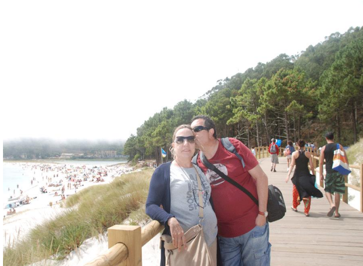
Islas Cíes