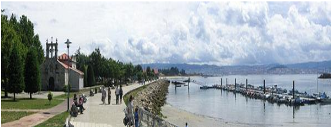
Cangas, paseo marítimo