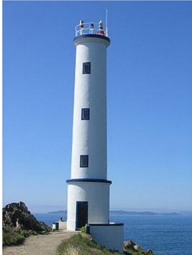
Cangas faro del Cabo Homes