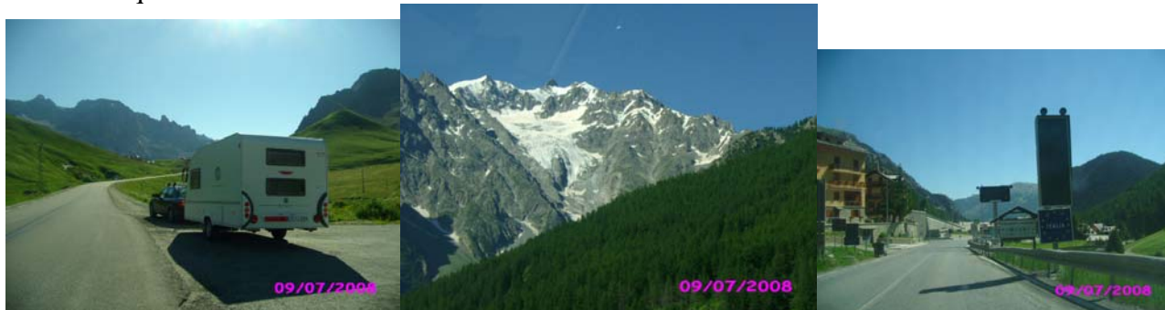
Bourg d'Oisans – Pisa

En este camping los españoles rivalizábamos en número con los holandeses que fueron mayoría en todos los demás que visitamos.