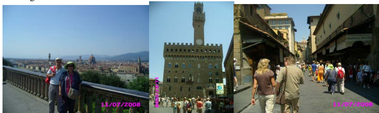
Pisa – Florencia – Pisa

DÍA 11 (Viernes): Dedicamos la mañana a trasladarnos a Florencia por la FI-LI-PI y recorrer su centro. Para aparcar usamos la Piazzale Michaelangelo (único parking gratuito), allí está el mejor mirador sobre la ciudad y desde allí se inicia una bajada hasta el río Arno para llegar al Ponte Vecchio donde iniciamos la visita. Para volver al parking cogemos el autobús desde la estación de tren. Regreso, con parada para repostar en las afueras de Florencia (1,492€), al camping de Pisa, un buen rato de piscina y por la noche nuestros amigos italianos nos llevaron a ver la elección de Miss-Tirrenia.