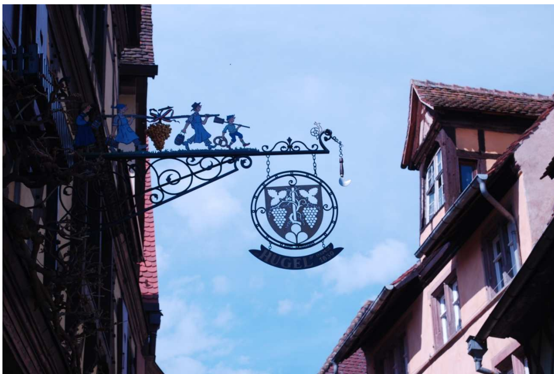
Riquewihr, detalle de una casa

Terminada la visita y dado que es pronto nos marchamos para Riquewihr 5,9 Km, este pueblo ha salvado sus casas y murallas milagrosamente de todas las guerras y todas las demoliciones con lo que se conserva con el mismo aspecto del siglo XVI. Está lleno de animación, los alsacianos celebran la Pascua de manera distinta a nosotros, decoran sus casas con huevos de Pascua y conejitos; Llevábamos información escrita de todos los pueblos que íbamos a visitar, lo que nos vino de perlas, pues la Oficina de Turismo estaba cerrada.