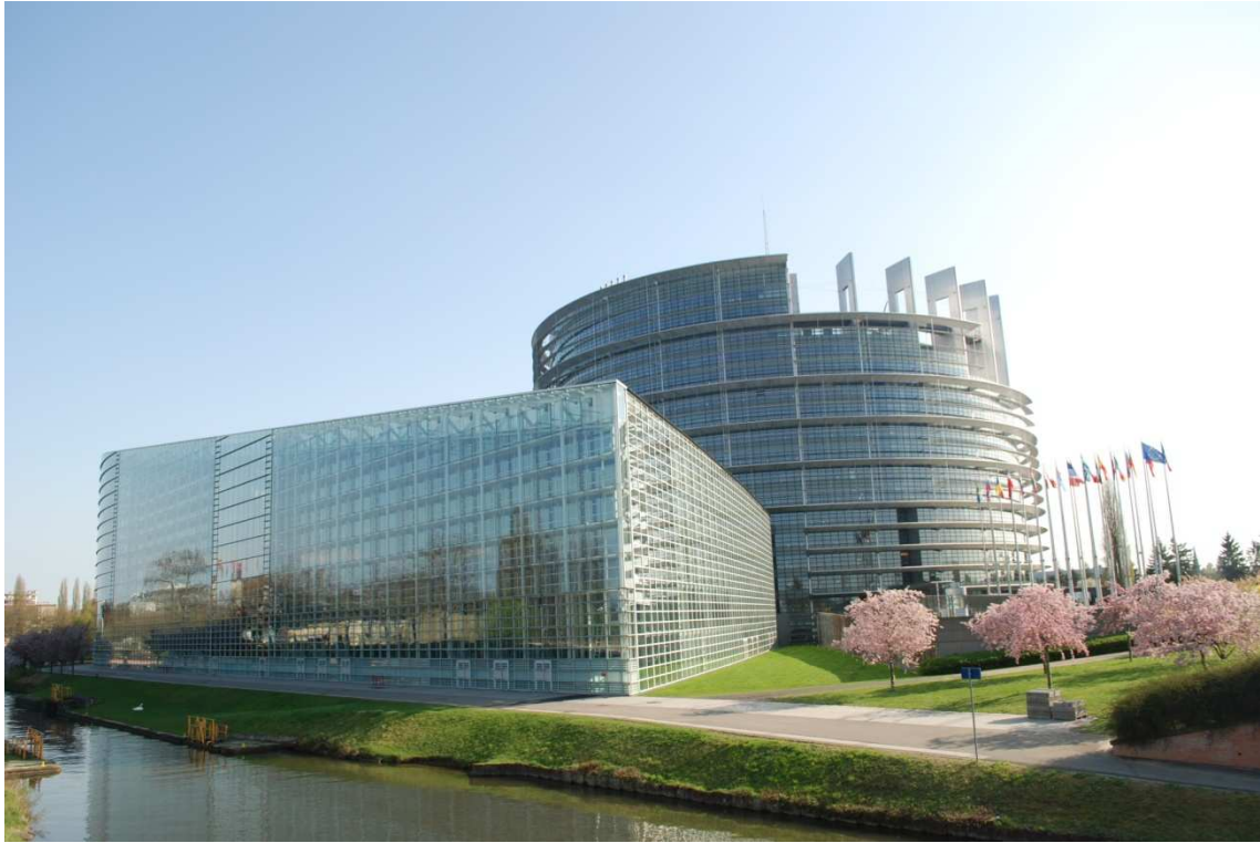
Strasbourg, Parlamento Europeo ©Foto Ana.