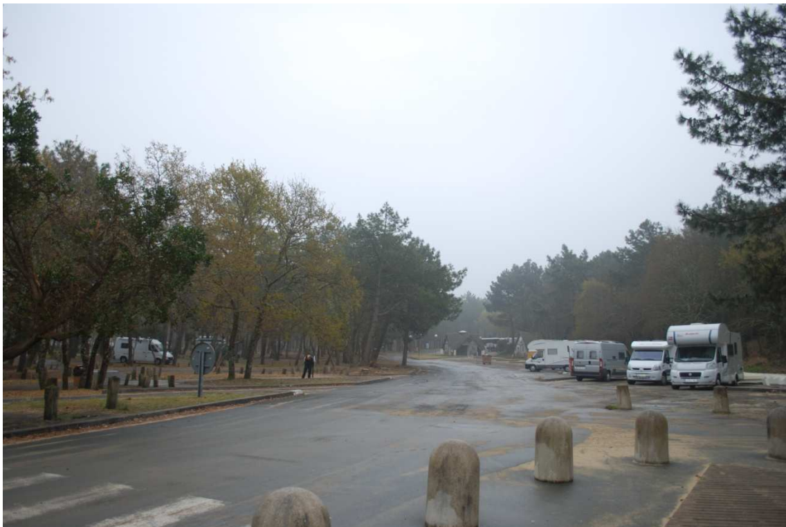
Dune de Pilat

Llegamos casi anochecido, aparcamos al lado de otras autocaravanas y nos disponemos a pasar la noche. Por la mañana veremos la Duna y continuaremos marcha hasta Besançon, craso error, pues el viaje se hizo tortuoso y desagradable.