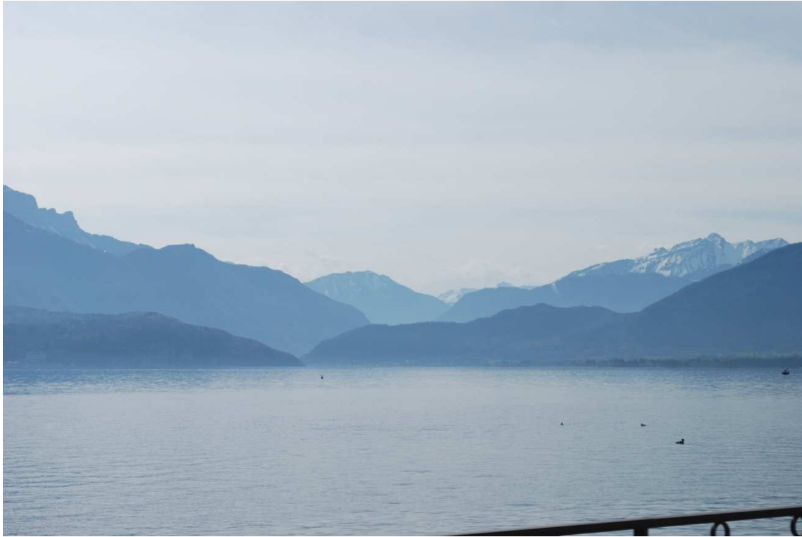
Annecy, Lago

Por la mañana después de desayunar y sacar al perro nos marchamos para Carcassonne con mucho dolor de corazón por no poder haber visto Annecy, nos queda el consuelo de que este verano volveremos a pasar por aquí y esperemos que haya más suerte esta vez.