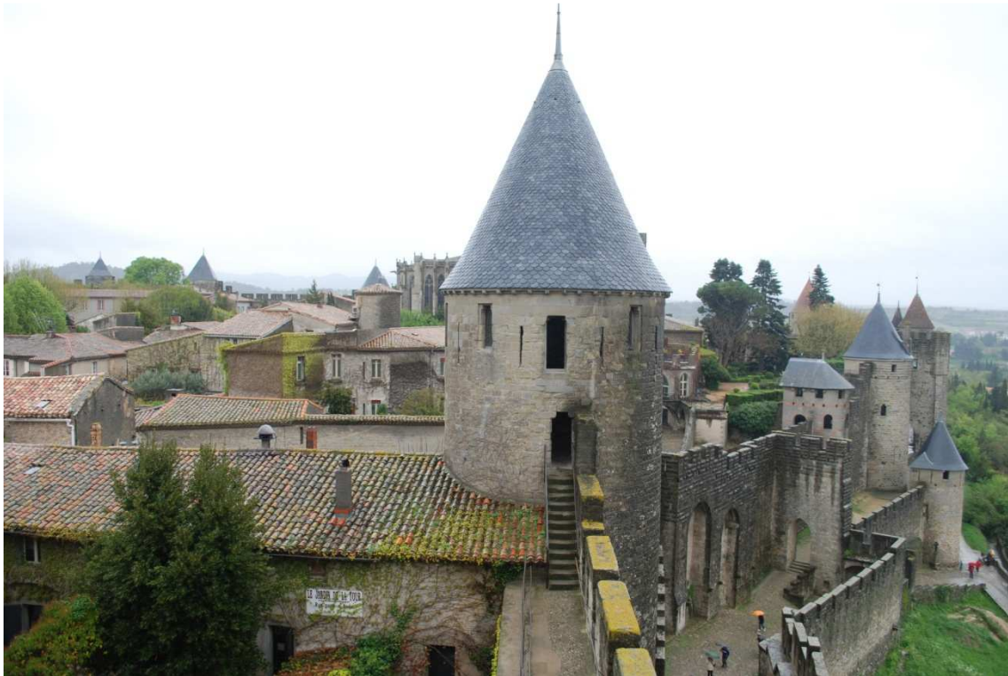
Carcassonne, La Cité

mejor que ponerse a cubierto, la segunda es imposible con la lluvia y decidimos marcharnos para Lérida, nuestro último destino antes de Getafe.