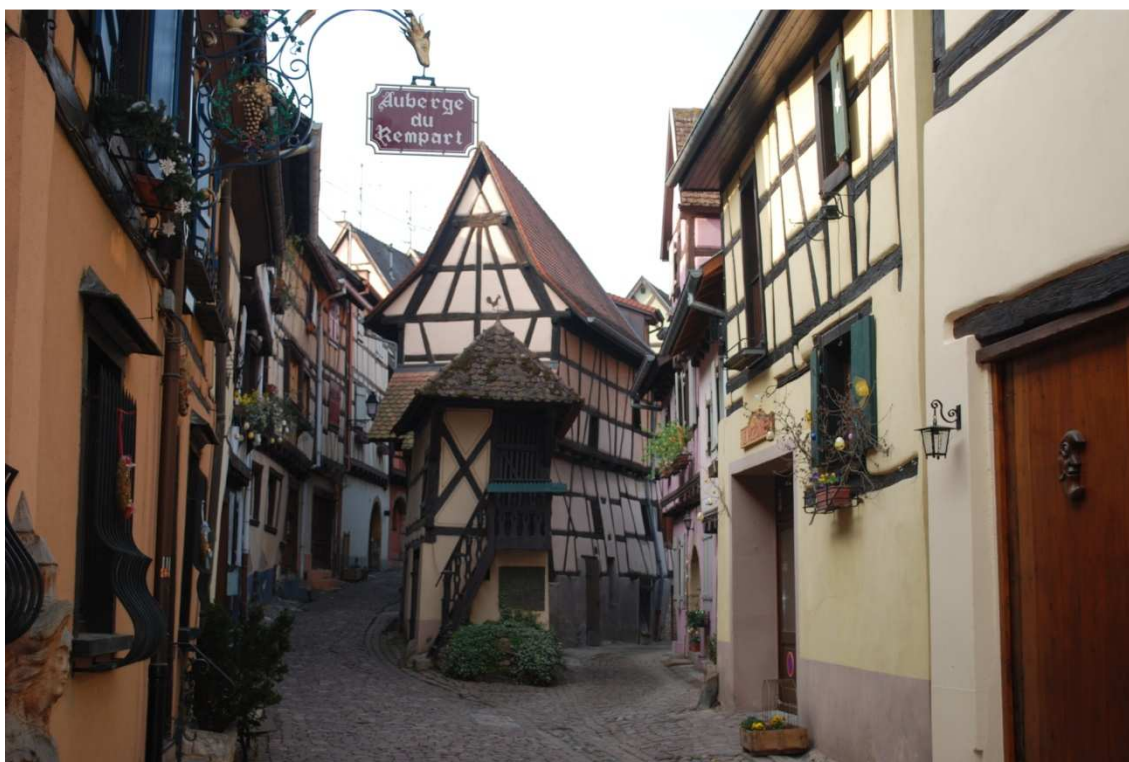
Casa típica alsaciana en Eguisheim

Nuestro primer contacto con Alsacia supera todas las expectativas, estamos en el pueblo de un cuento de hadas, la arquitectura de la villa está cuidadísima y las casas parece que las acaban de sacar de alguna caja para regalos. Las calles son concéntricas a un eje principal que es la plaza donde se encuentra la estatua del Papa León IX, nacido esta villa. Hay varias bodegas donde se puede comprar vino de Alsacia, las tiendas de suvenir están por todas partes ofreciendo casitas típicas alsacianas y cigüeñas, no olvidemos que es el pájaro estrella de estas tierras. La cerveza alsaciana también es típica y por supuesto está a la venta en todos los comercios.