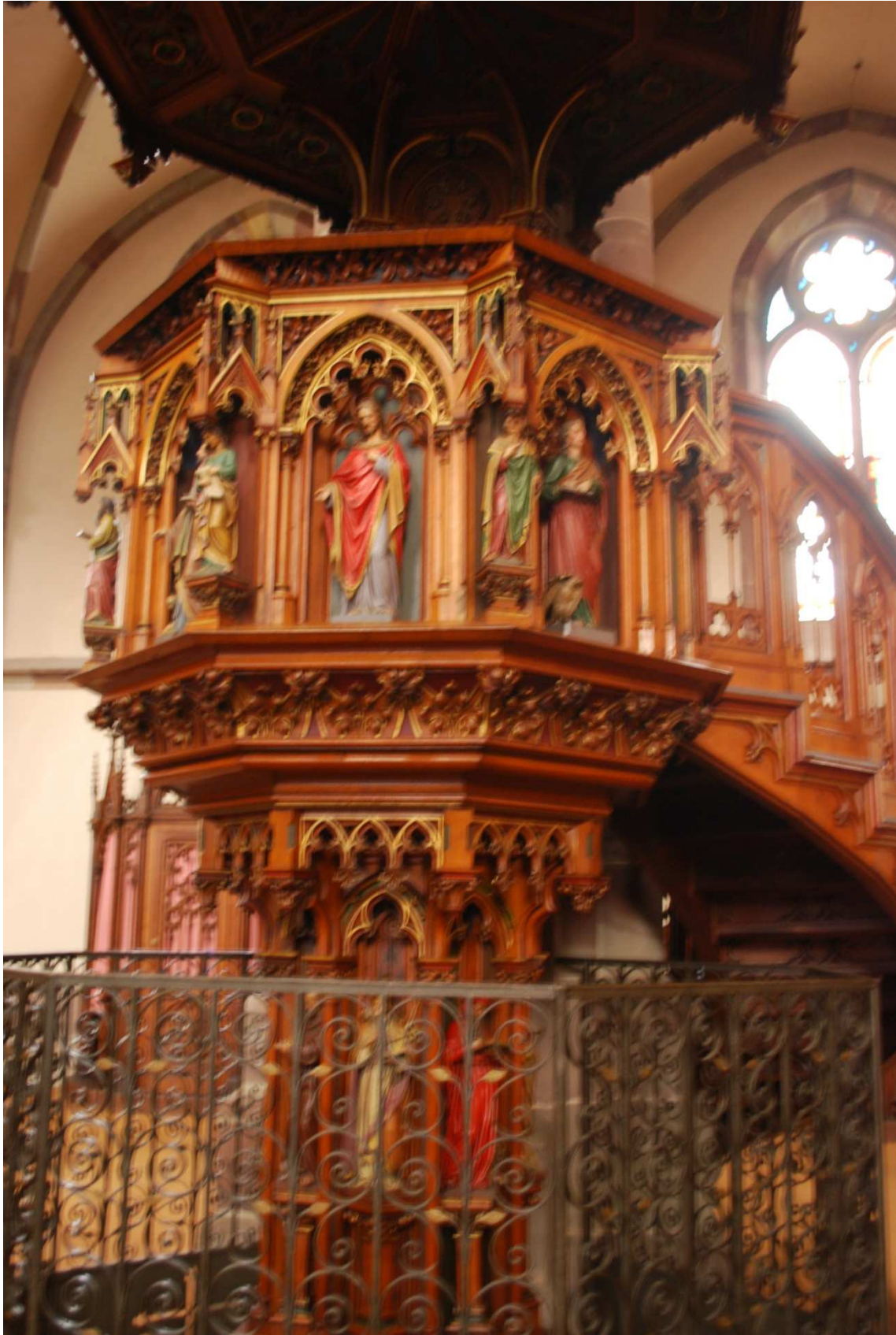
Obernai, Púlpito de la Catedral