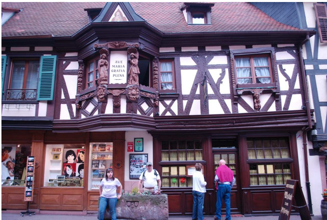
Ribeauville, La Pfifferhüss

Sinn es una de las que más encanto tienen, está repleta de casas típicas alsacianas con una fuente en el centro donde hay una estatua de André Fridrich.