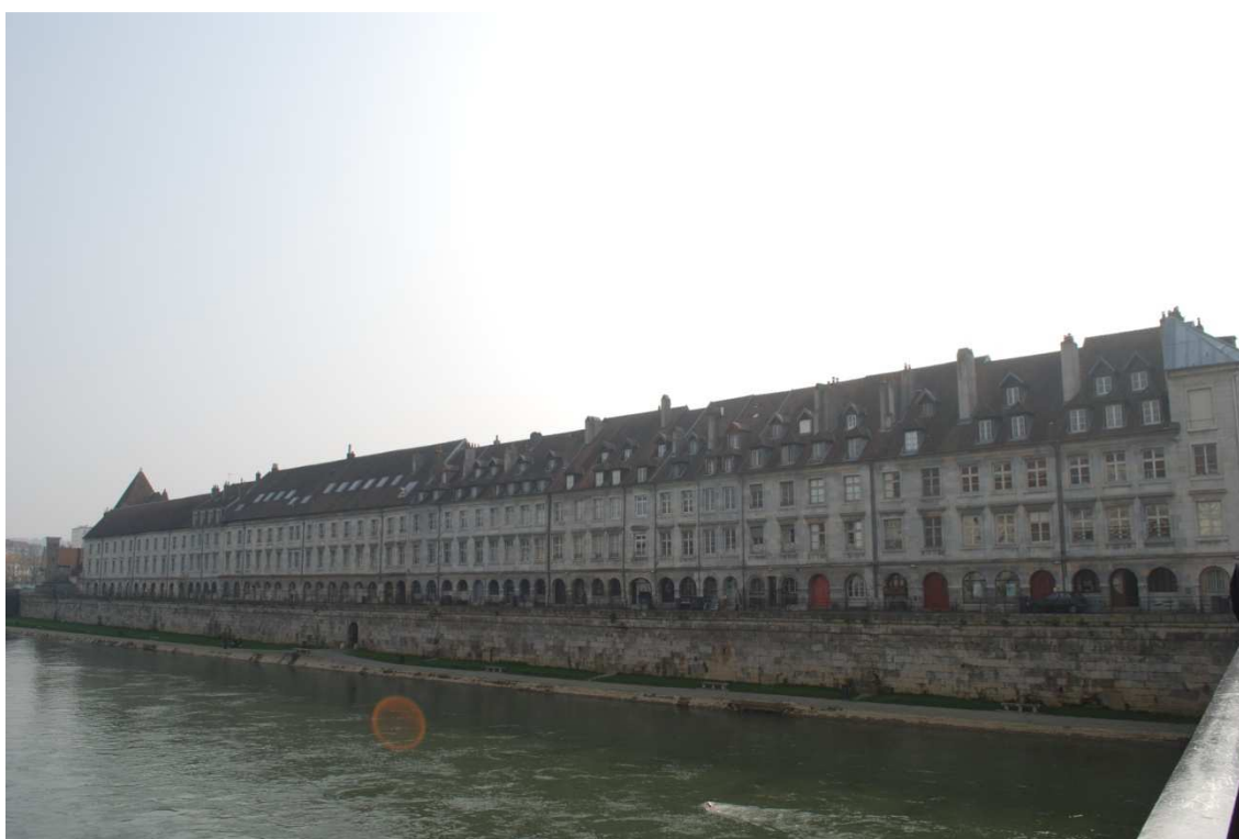
Orilla derecha del Doubs desde el puente de Battan   Foto Ana

La Catedral es peque a pero coqueta, Ana y Sara se fueron despu s de comer a ver el reloj astron mico de la Catedral al volver diversidad de opiniones, magnifico para Sara y "bueno yo me esperaba otra cosa" para Ana, yo me qued  lavando la vajilla y colocando la auto para continuar camino de Eguisheim; el parquin es gratuito por ser domingos pero bastante jodido para salir pues la curva no daba radio para la ac, en fin que salimos con dificultad pero salvando los muebles.