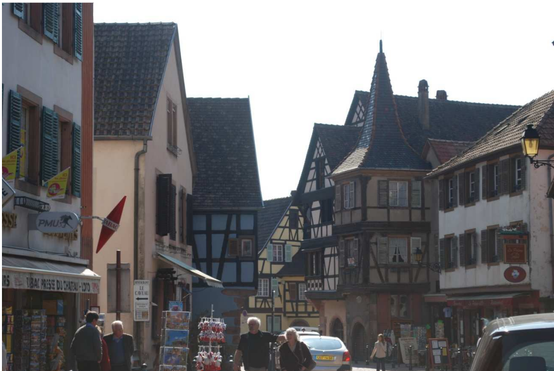
Kaisersberg Rue du fer R.C.A.

La visita a la ciudad empieza como es de rigor en Ana por la oficina de turismo y recoger información de la villa, he de decir que hasta ahora no hemos encontrado esa información en castellano, siempre en francés, inglés o alemán. Seguimos la ruta marcada por el plano de la oficina y recorreremos el pueblo, Kaysersberg ha sabido guardar ese sabor medieval que impregna el ambiente y vas saboreando conforme te vas adentrando por sus calles. Hay un pozo en la ciudad con un cartelito que viene a decir más o menos que bebas buen vino en las comidas, pues el agua te helará el estómago y le dejes el agua a él.