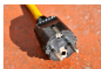
CH4000E: Europeo 2-pines

Sólo una parte del recinto tiene energía eléctrica 220 v. Así pues todos los autocaravanistas que hayan solicitado energía eléctrica (máximo 250 tomas de amp. cada una) estarán ubicados en el parking mientras que los otros se instalarán en la zona del Kartódromo.